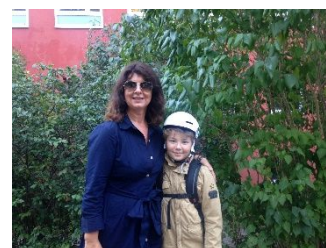
Archivbild: erster Schultag am Elsa