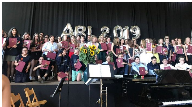
Archivfoto: Abiturfeier 2019 am Elsa

All diese Projekte und viele andere, die vielleicht im kleineren Rahmen ablaufen, sind dem großartigen, beherzten und ehrenamtlichen Engagement der Lehrer:innen und der Schulleitung am Elsa zu verdanken – dies kann man gar nicht genug loben! Denn neben ihrem herausfordernden Berufsalltag setzten sie sich persönlich für die Interessen und Wünsche unserer Kinder und Jugendlichen am Elsa ein: mit inspirierenden Ideen und deren Umsetzung – stets zur kreativen und ideellen Bereicherung sowie zum Wohle der ganzen Schülerschaft. Herzlichen Dank dafür! Wir, der Elsa-Förderverein e.V., unterstützen diesen Einsatz, der das Schulleben zusätzlich bereichert.