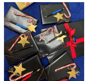
Geschenke für den Lesewettbewerb

Im Dezember haben wir durch die Einladung der Schulleitung nicht nur für einen feierlichen Rahmen beim Lesewettbewerb der Sechstklässler:innen gesorgt. Bedingt durch die strikten Corona-Auflagen haben wir im sehr kleinen Kreis – gemeinsam mit Herrn Bußjäger, ein paar Lehrer:innen und einem Mitglied des Elternbeirats – in der Schulbibliothek eine Jury gebildet und die Gewinnerin des Lesewettbewerbs am