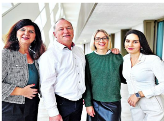
Der Vorstand seit November 2022

Auch in diesem Geschäftsjahr konnten wir mit vielen unterschiedlichen Herzensprojekten zu einem gelungenen Schulalltag an unserem Elsa beitragen. Los ging es mit einem Geschenk für alle Schülerinnen und Schüler der 5. Jahrgangsstufe am ersten Schultag. Beim ersten Elternabend haben wir den neuen Eltern unseren Förderverein vorgestellt und aufgezeigt, wie wir uns dank der Spenden zum Wohle der Schülerschaft einsetzen und auch auf unsere Willkommensgeschenke, rote Elsa-Förderverein-Bleistifte hingewiesen, die zusätzlich als kleiner „friendly reminder“ dienen sollten, uns mit einer Spende zu unterstützen und/oder Mitglied zu werden.