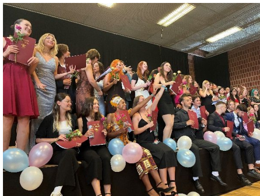
Abi 2023 am Elsa

Beim Sommerfest Ende Juli waren wir auch mit einem Stand dabei, wo es Espresso, Häppchen und einen guten Austausch mit Eltern und Schülern gab.