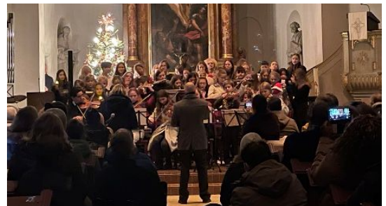
Voller Klang, Glanz und Herzenswärme: das Weihnachtskonzert des Elsa