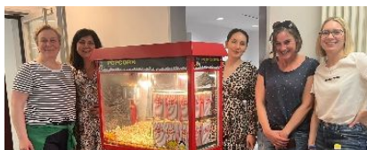
Packen zusammen an: Elternbeirat und Förderverein

Im Mai sind die Klassen 9c, 10a+10b in den Genuss eines Sozialkompetenztrainings gekommen. Das Feedback der Lehrer*innen war durch die Bank positiv. Die Trainer vom Anbieter Abinko haben ihr Programm auf die aktuelle Situation der Klassen zugeschnitten und sind mit bestimmten Übungen zur Förderung der Sozialkompetenz auf die jeweilige Dynamik und Besonderheit der Klassen eingegangen.